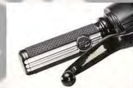
Lenkergriffe Chrom Softailmodelle ab '16 Touringmodelle ab '08 HD 56100158