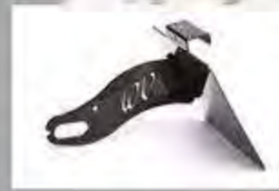
WV1016 Seitl. Kennz.Halter WV Universal Pulverbeschichtet