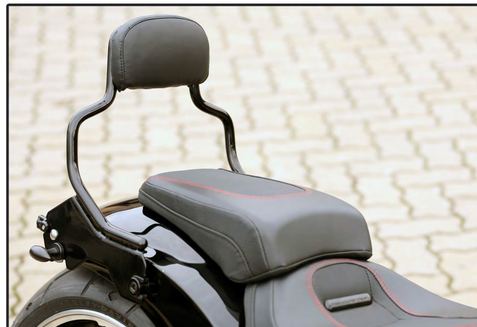
Auf Wunsch mit abnehmbarer Sissybar

HDWV Heckteil Kleine Blinker Seitl. Kennzeichen inkl. Heckteil Lackierung auf Termin innerhalb einer Woche nur 2200.- inkl. MwSt.