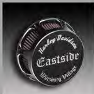
WV1014 MW8 ESC Luftfilter