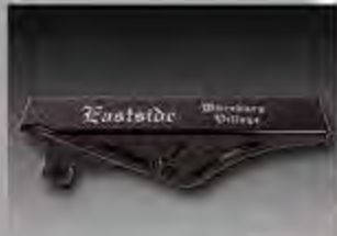
WV1010 MW8 ESC Alu Riemenschutz Softail