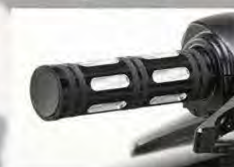
Lenkergriffe Edge Cut Softailmodelle ab '16 HD 57457 10