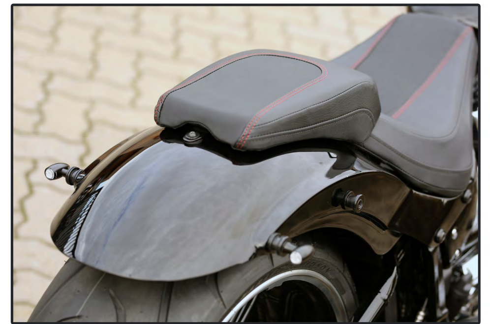
HDWV Heckteil bis 200er Hinterreifen