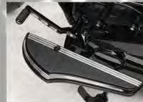
Trittbretter Chrom FL Softail ab '18 HD 50500797