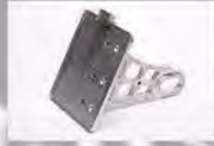
WV1018 Seitl. Kennz.Halter Aluminium Gefräst