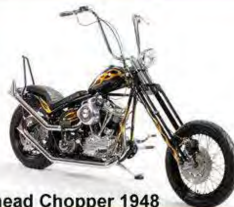
Panhead Chopper 1948