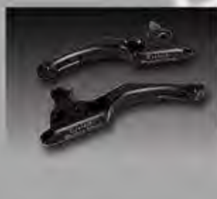
WV1003 MW8 ESC Design Handhebel Softail