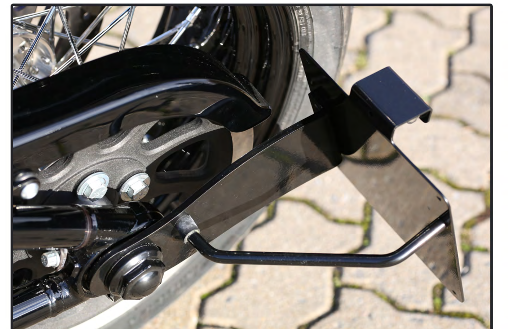
HDWV seitlicher Kennzeichenhalter