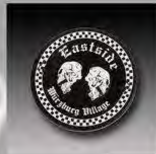
WV1011 MW8 ESC Timer Cover