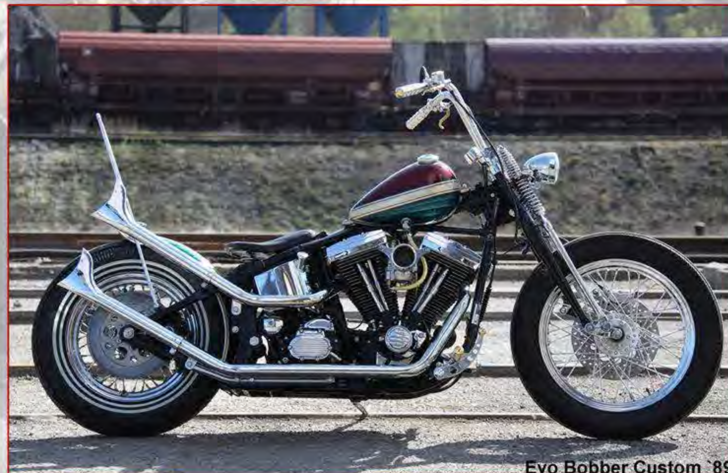
Evo Bobber Custom '89