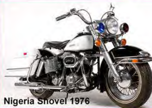
Nigeria Shovel 1976