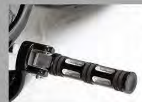
Fußrasten Edge Cut Softailmodelle ab '16 HD 49312-10