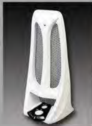
WV 1006 MW8 ESC Design Bugspoiler Typ B Softail