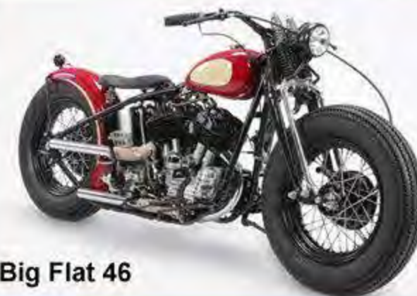
Big Flat 46