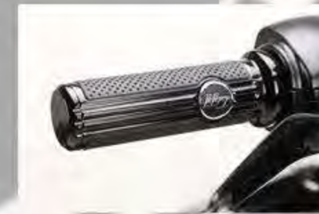
Lenkergriffe Defiance Softailmodelle ab '16 HD 56100159