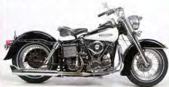
Early Shovel '68

Wir reparieren oder restaurieren Eueren Oldtimer in unserer Oldtimerwerkstatt komplett. Mit unserem neuen Maschinenpark der ehemaligen Firma Monster Motors sind wir in der Lage alle alten Motoren instand zu setzen. Oldschool ist für uns Passion, denn damit sind wir aufgewachsen. Unsere Jahrzehnte lange Erfahrung ist Euer Vorteil.