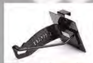
WV1015 Seitl. Kenn.Halter HDWV Universal Pulverbeschichtet