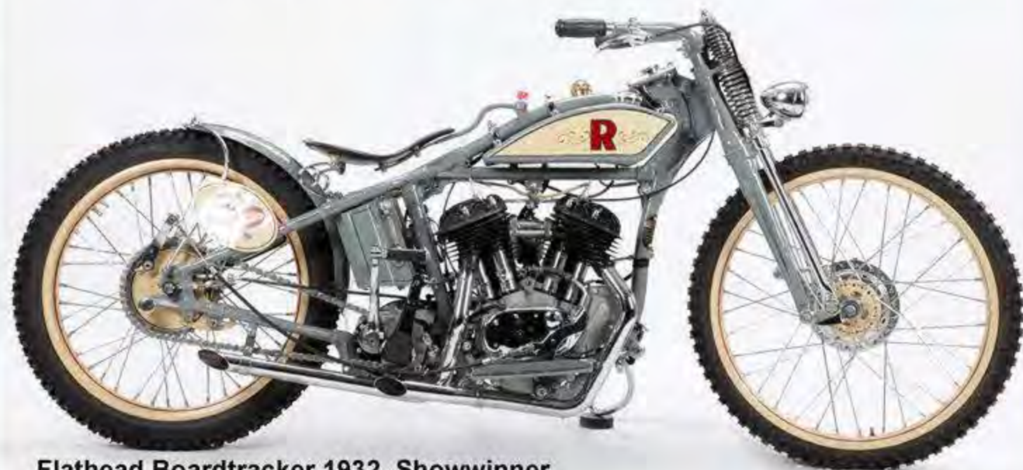
Flathead Boardtracker 1932 Showwinner