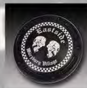
WV1008 MW8 ESC Derby Cover Klein