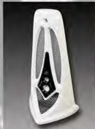
WV1005 MW8 ESC Design Bugspoiler Typ A Softail