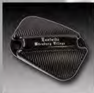
WV1002 MW8 ESC Deckel Bremsflüssigkeitsbehälter Softail