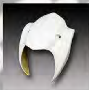
WV1004 MW8 ESC Lampenmaske Breakout