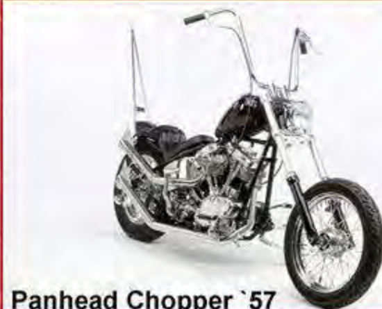
Panhead Chopper '57