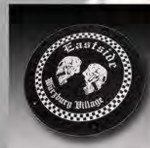
WV1007 MW8 ESC Derby Cover Groß