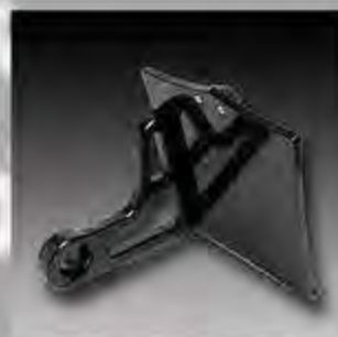
WV1013 MW8 ESC Seitl. Kennz.Halter Softail