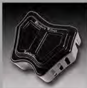
WV 1001 MW8 ESC Zündspulencover Softail