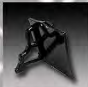
WV1012 MW8 ESC Seitl. Kennz.Halter FXDR