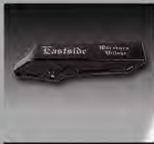
WV1009 MW8 ESC Alu Riemenschutz FXDR