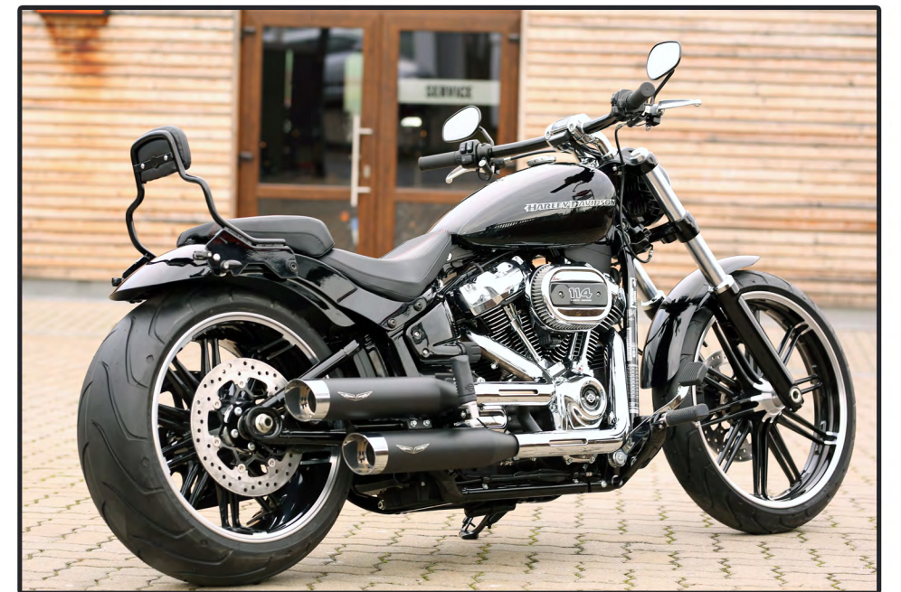
Original Tank und original Sitzbank